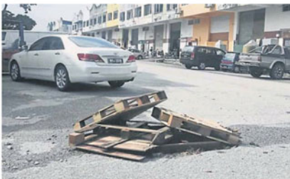
好心的商家用木板把洞盖住。