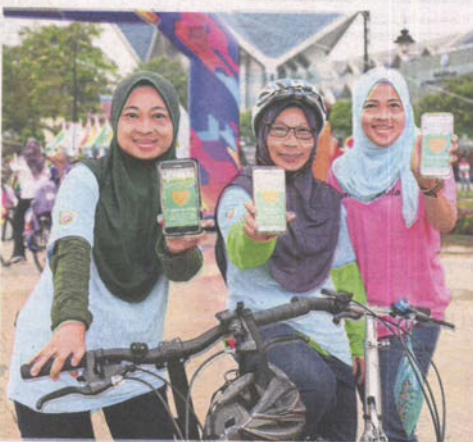
Thanks to the support and votes of people living in Shah Alam, the city was placed 22 out of the world's top 50 cities in the We Love Cities 2018 competition by WWF.

quite an uproar. It prompted the Sultan of Selangor to decree that all road signs in Shah Alam must be in Bahasa Malaysia.