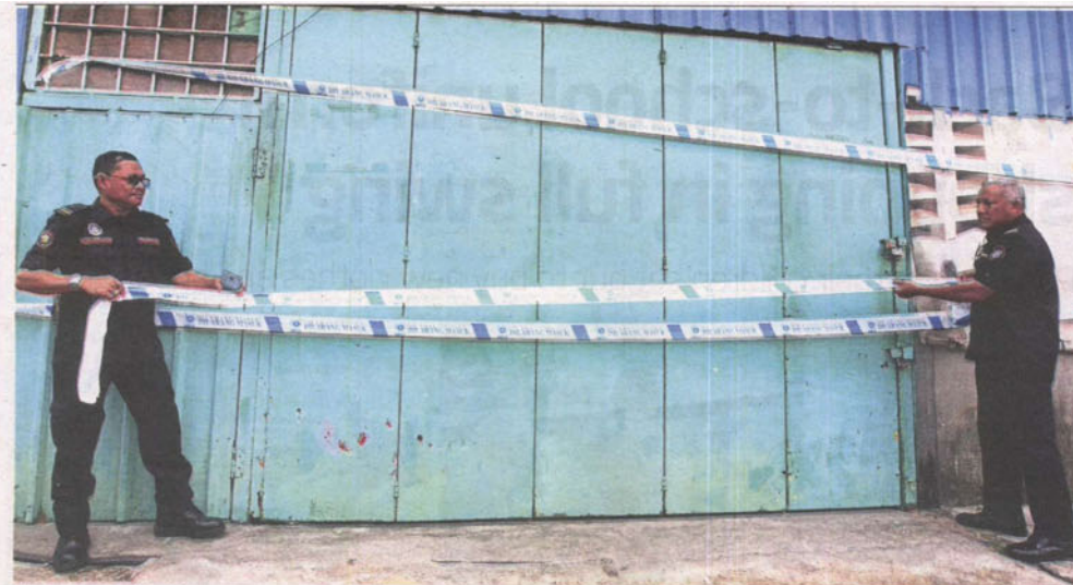
MBSA officers sealing off a store selling counterfeit alcoholic drinks at Kampung Baru Sungai Buloh on Sept 19.

Mayor Datuk Ahmad Zaharin Mohd Saad said MBSA had issued a temporary operating licence prior to the incident.