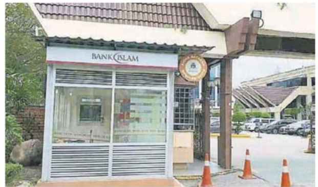
士拉央市议会外的自助缴纳机24小时开放，方便民众在任何时间缴税。