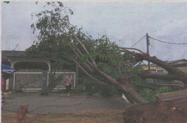
Trees came crashing down on two houses in Lintang Muda Klang during a spate of flash floods in October.

0.8ha land belonged to the Selangor Islamic Religious Department and Selangor Drainage and Irrigation Department (IPS) and the owner of the farm had to be evicted.