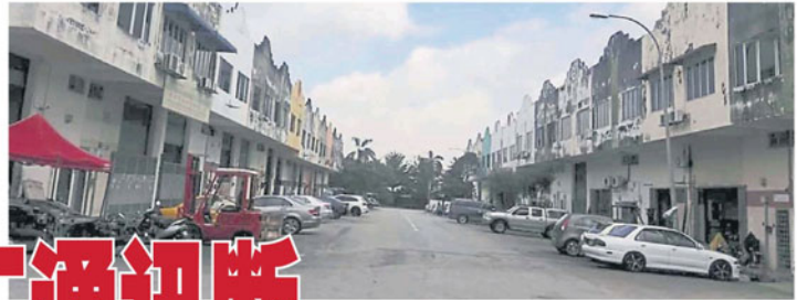
利丰工业区 500 多间厂家陆续面对电讯服务被干扰问题。

受困扰而搬迁！ 据了解，匪帮是于三、四年前起在该工业区出没，而今年 10 月至今，偷窃电讯电缆的问题猖獗。