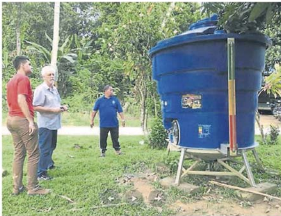
里奥(中)在其中一甘榜向村民了解当地水源收集过程。