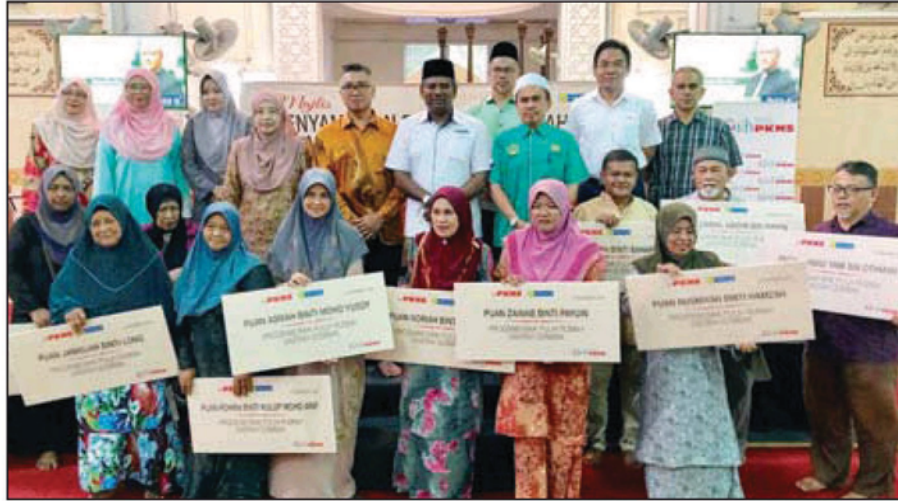
诺丽达（后排左4）与受惠家庭合照。