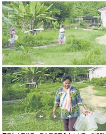
卫生水源缺乏, 原住民提著多个大水瓶, 步行到食水供应处取水。