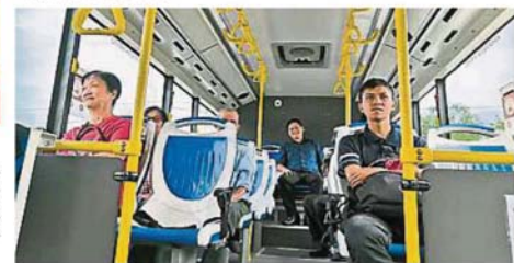
►疑因新推出并遇上学校假期,以致第3路线的乘客不多。