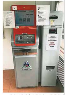
民眾可使用自助繳納機,繳付雪州所有地方政府及土地局的費用及罰款。