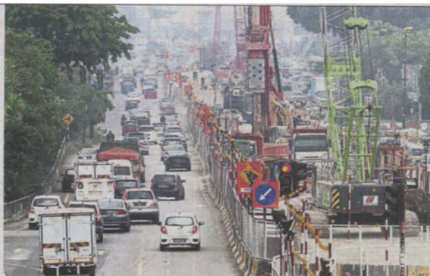
Motorists are confused with the lane markers on Klang roads that are either overlapping or criss-crossing, posing a danger as vehicles have no designated lane to be on.