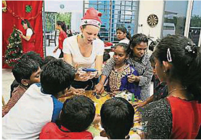
白衣义工正教小朋友如何制作圣诞手工。

(沙亚南26日讯)配合圣诞节来临, 耕心慈善协会与15名热情的志愿者为来自3间不同的敬老院及儿童院的103名长者及儿童举办一场欢心与喜悦的圣诞节夜晚。