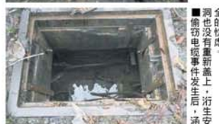
全的忧患。偷窃电纜事件发生后, 治安