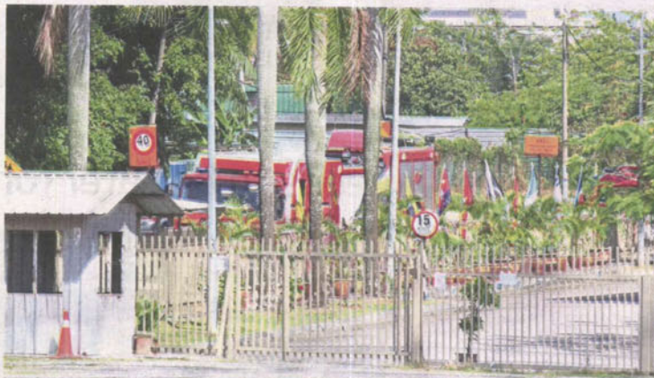
The closed off Jalan Nagasari where the ammonia gas leak at an ice factory occurred.

A most recent incident involved signboards in Shah Alam with Chinese characters that created