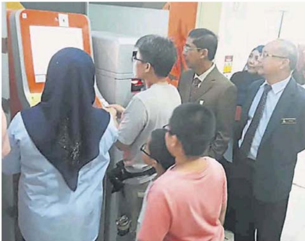
士拉央市议会推介自助缴付机，让民众缴付大部分费用。