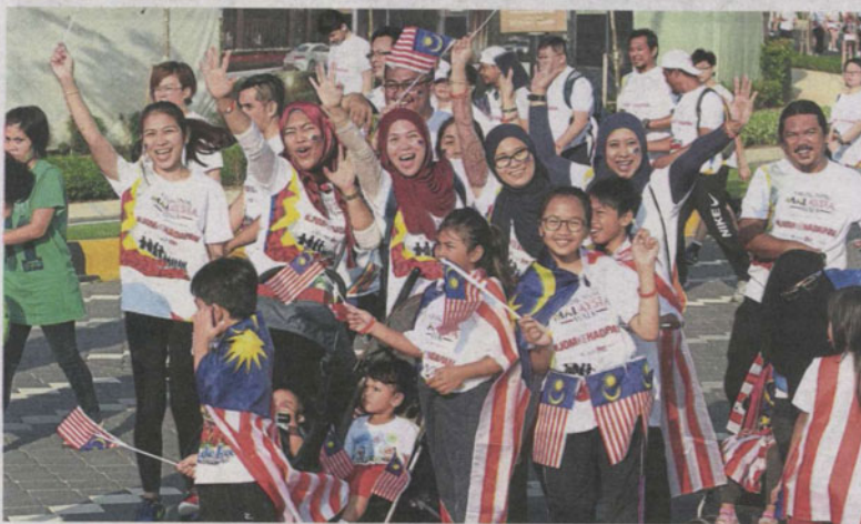
Malaysians from all walks of life taking part in the AnakAnak Malaysia 2018 Walk at Eco Ardence, Shah Alam.

City dominated headlines for wrong reasons but made positive progress towards sustainability