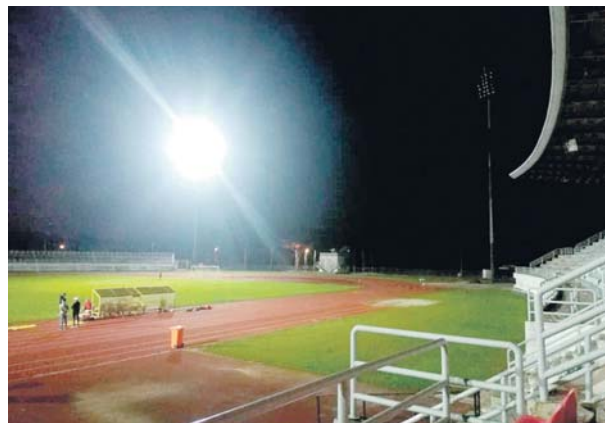
Kemudahan lampu yang didakwa tidak berfungsi dengan baik di Stadium Kuala Selangor.

Lebih mengecewakan, lampu tidak terang merosak-