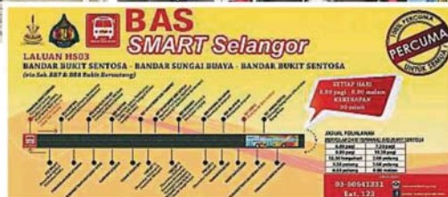
▲乌雪精明巴士的第3路线,将途经多个花园住宅区、工业区和4所学校。

“新路线以桃源岭巴士站为起点和终点,从清晨6时至夜晚8时提供服务。巴士来回一圈共90分钟,中间共有23个车站。当中一年约60万令吉的开销由州政府悉数承担。”