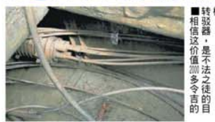
转駁器, 是不法之徒的目标。相信这价值逾多令吉的目

对方千案的手法非常熟练, 整个过程也只需要10至20分钟, 当警方来到现场时, 对方早已不见人影。