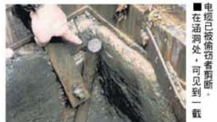
电纜已被偷窃者剪断。在涵洞处, 可见到一截