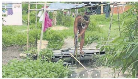
对先进城市孩子而言, 在公共水喉取水很不可思议, 但对没有个别水管供水的原住民而言, 公共水喉解决了他们的饮用水问题。

里奥指出, 受水坝计划影响的村民抱怨, 他们的基本需求不再获得政府支持。 他促请政府, 在决定实施供水大型计划之前, 展开详细的研究, 以确保所有人口的水供安全。 “有人抱怨这些甘榜不再获得政府支持基本需求, 因为, 这些计划若继续进行, 4个甘榜将被淹没, 另外5个甘榜将因其他原因需要重新安置。” 他说, 在大水坝修建之前, 居住在受影响甘榜的居民, 没有得到政府的高度关注, 因此估计, 一旦巨坝竣工, 这些甘榜将消失, 例如沙巴州南邦县的甘榜淡巴雅沙, 将受建议中的拟议的凯端(Katuan)水坝影响。 “建造水坝之後, 需仔细监测生计, 特别是流离失所者和留在原地的人口, 获得水和卫生设施的方法。”