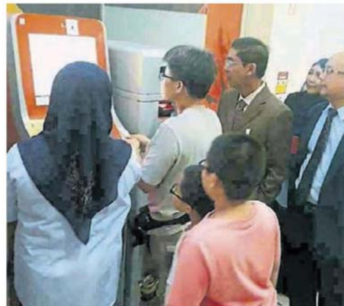
可在市议会内缴付大部分费用。士拉央市议会推介自助缴纳机，让民众

另外，苏里曼也指出，市议会已通过会议决定，将原本的1万令吉售酒执照抵押金调低60%，此外，除了售酒执照可获这项折扣，其他类型执照包括，彩券行（Kedai Nombor Ramalan）、修车厂、摩哆修理厂和洗车厂的执照抵押金也同享此优惠。