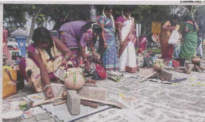
Participants preparing the sweet rice at the Ponggal competition.