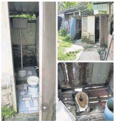
一郊区甘榜或原住民村, 没有卫生供水, 居民需取水冲洗手间, 抽水设备形同虚设。

里奥是受我国政府邀请, 于今年11月15日至27日勘察与访问, 并在上个月27日, 公布他在2周内访问吉兰丹州、沙巴及砂拉越州的原住民村的勘察, 以及访问原住民权益组织与环保分子的报告。 大馬水資源豐富 他说, 虽然大马有丰富的水资源, 但是, 他在季风季节访问大马时, 看见蓝色的水箱被用来收集城市和农村地区的雨水。 他也说, 他与原住民相处的短暂时间里, 了解并看到每个社区旁的河流被用于多种用途, 作为洗涤的水源和代替如厕的地方。 里奥指出, 一些伐木、大规模油棕种植、棕榈油加工厂, 以及农药的使用, 也影响了人们获得安全饮用水的机会。 他说, 在山打根, 位于隐秘区域的非正规居住点, 人们依靠来自河流、工厂的自备水或近山的引力供水; 一些沿海甘榜村民, 则得乘船前往另一个甘榜取水。 里奥在2个星期的勘察与访问期间, 与水务、土地与天然资源部、房屋与地方政府部、教育部、卫生部、环境局、国家水供服务委员会、马来西亚水协会、原住民发展局、雪州水供公司、沙州水务局山打根办事处、古晋与诗巫水务局, 以及人权委员会代表见面交流。