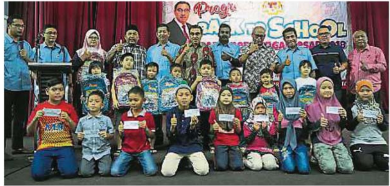
慕斯里敏(站者中)与出席仪式的嘉宾及受惠学生合照。